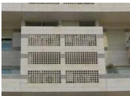
מסתור פריקסט שקוע בחזית